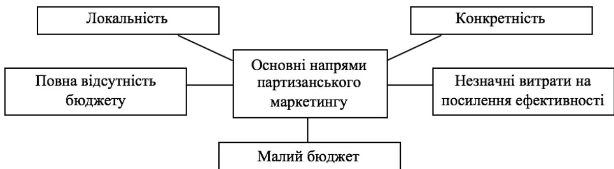
Рис. 1. – Напрями партизанського маркетингу

Серед методів партизанського маркетингу можна виділити кілька напрямків (рис.1):