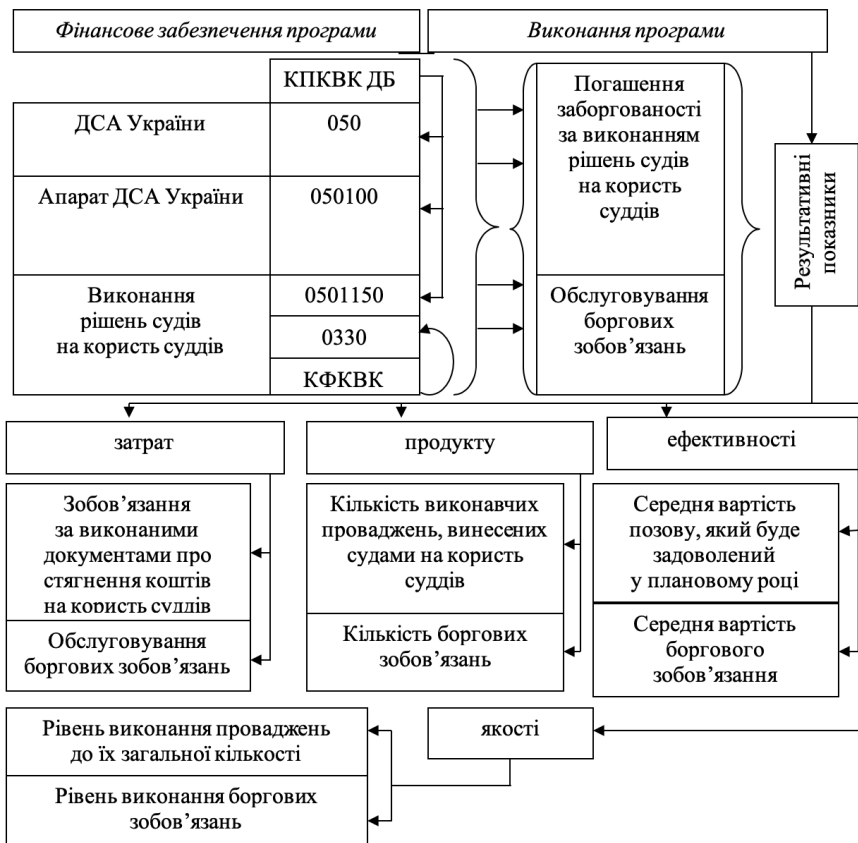
Рис. 1. Складові та результати здійснення видатків за бюджетною програмою 0501150 «Виконання рішень судів винесених на користь суддів»

Для забезпечення безспірного списання коштів державного бюджету в Держказначействі відкривають в установленому порядку відповідний рахунок. Перерахування коштів стягувачу здійснює Держказначейство у тримісячний строк із дня надходження відповідних документів і відомостей. Казначейство веде бухгалтерський облік, складає звітність про здійснення в установленому порядку безспірного списання коштів державного бюджету. Держказначейство здійснює списання коштів за бюджетною програмою 0501150 «Виконання рішень судів на користь суддів» за такими кодами економічної класифікації: 22730 «Інші виплати населенню» та 2800 «Інші поточні видатки» (рис. 1) [7].