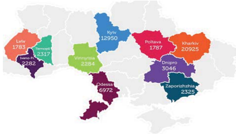
Рис.3 Распределение численности иностранных студентов по областям Украины на 01.01.2016. Составлено авторами на основе данных: [6].

Иностранные студенты учатся преимущественно в ВУЗах Харькова, Киева, Одессы, Днепра, Запорожья, Винницы, Львова (рис.3).