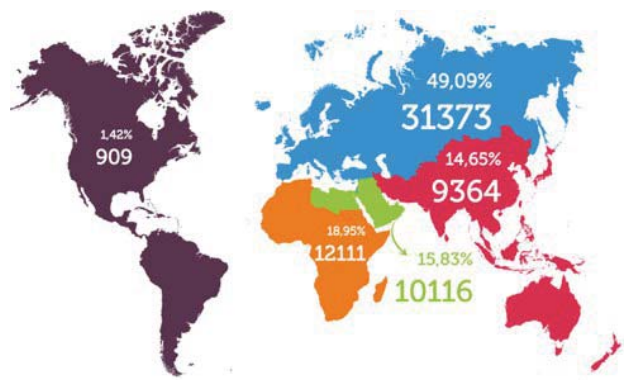
Рис.2 Численность иностранных студентов в Украине по странам происхождения на 01.01.2016.

Украина привлекает студентов из бывшего СССР, стран Азии, Африки, Ближнего Востока, Латинской Америки (рис.2).