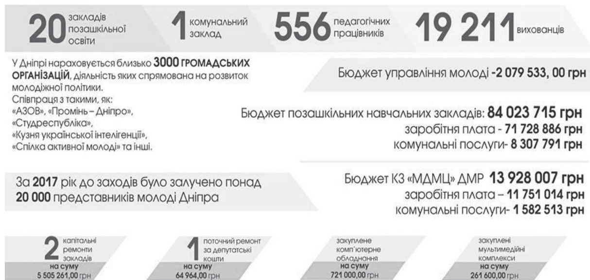
Рис. 2. Звіт за рік стосовно відкритих можливостей для молоді в умовах децентралізації.

- Вчитель року – рейтингово-конкурсна програма для вчителів. У 2017 році більше 30 осіб отримали грошові премії.