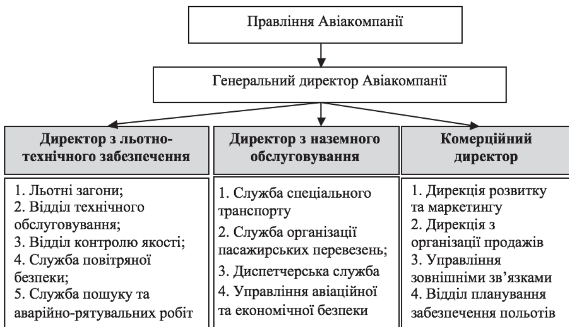
Рис. 2. Піраміда відповідальності у авіакомпанії «Українські Середземноморські Авіалінії» Складено автором

Згідно з фрагментом сфер відповідальності авіакомпанії «Українські Серед-земноморські Авіалінії», представленим на рис. 2, керівник льотного загону відповідає лише за витрати, пов'язані зі здійсненням польоту, натомість директор з льотно-технічного забезпечення польотів контролює не лише прямі витрати на здійснення польотів, але й накладні витрати пов'язані з утриманням відділів контролю якості, технічного обслуговування та авіаційно-рятувальних робіт. У свою чергу генеральний директор Авіакомпанії, поряд з витратами отриманими в льотно-технічному комплексі та комплексі з наземного обслуговування, контролює ще й доходи, що утворилися в комерційному комплексі.