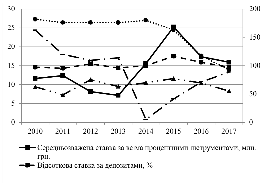
Рис. 1 Динаміка зміни показників функціонування банківського сектору в Україні за період 2010-2017 років

порівнянні із 182 у 2010), середньозважена ставка за всіма процентними інструментами з 2012 року зросла в двічі (16% у порівнянні з 8,13%), аналогічна нестабільна ситуація спостерігається і за рештою показників функціонування банківського сектору в країні, основні з яких наведені на рисунку 1.