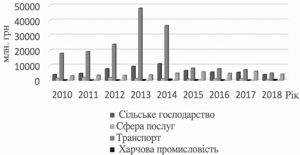
Рис. 2. Розподіл вартості чинних договорів фінансового лізингу за галузями, 2010-2018 рр., млн. грн

Джерело: складено на основі: [7, 12, 13, 14, 15, 16].