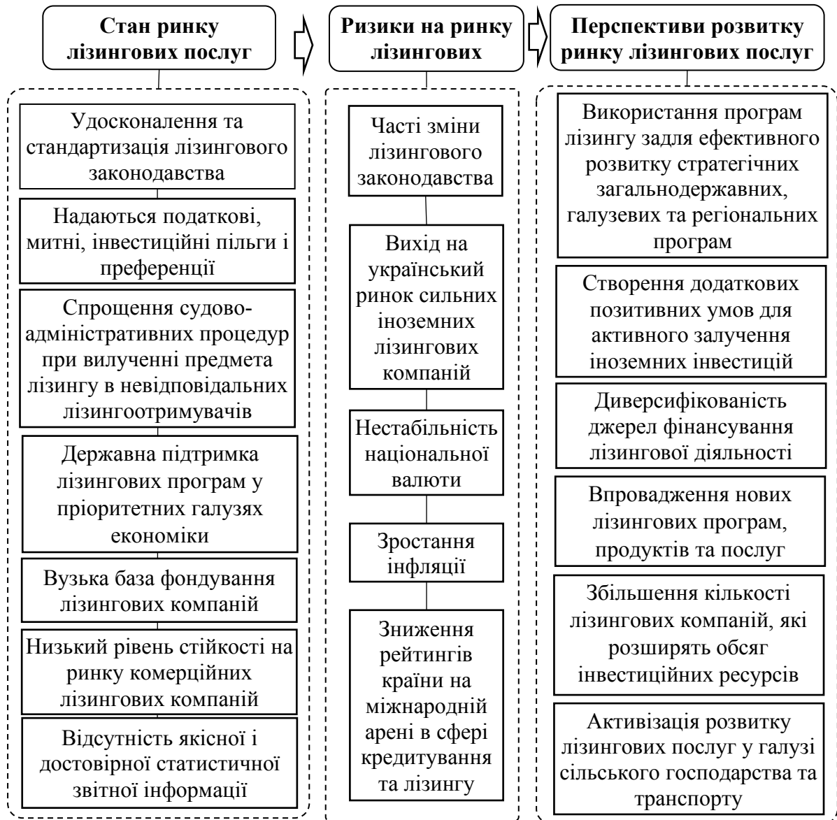
Рис.3. Аналіз напрямів розвитку ринку лізингових послуг в контексті трансформації фінансових відносин в Україні

додаткові позитивні умови для активного залучення іноземних інвестицій. Саме це вирішить питання про нездатність багатьох підприємств України проводити реконструкцію та модернізацію виробництва за допомогою лізингу.