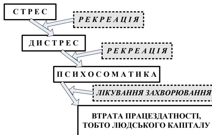
Рис. 2 Місце необхідних процесів рекреації в життєдіяльності людини

Таким чином, здійснені у ХАТМК дослідження кроунограм людей до та після перегляду спектаклів виявили невідоме раніше явище – «здібності» театру «загоювати» енергоінформаційні оболонки («аури») глядачів. Це відкриття підштовхнуло до висновку про ще одну (і може найважливішу) функцію театру – рекреаційну, завдяки чому людина після праці має можливість відпочити і відтворити свій так званий людський капітал [12]. При порушенні цього правила людину чекає ланцюжок подій та станів, який наведено на рис. 2.