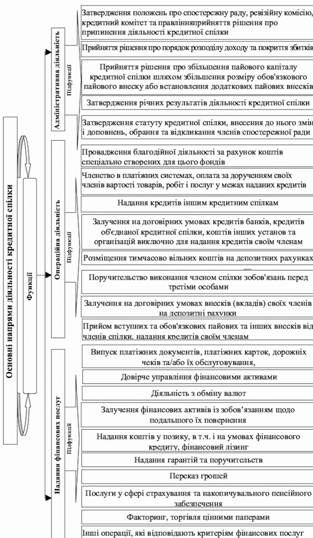
Рис. 1. Функціонально-організаційна структура кредитної спілки