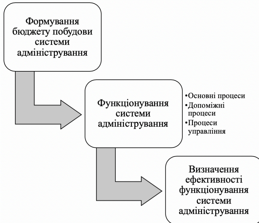
Рис. 2 Модель економічного обґрунтування побудови систем адміністрування

C_{ру} – витрати на реалізацію процесів управління у системах адміністрування.