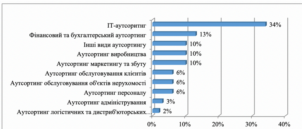
Рис. 1 Структура аутсорсингових послуг, що використовують зарубіжні підприємства

Структура видів аутсорсингових послуг, які є найпоширенішими для практики зарубіжних підприємств наведено на рис. 1.