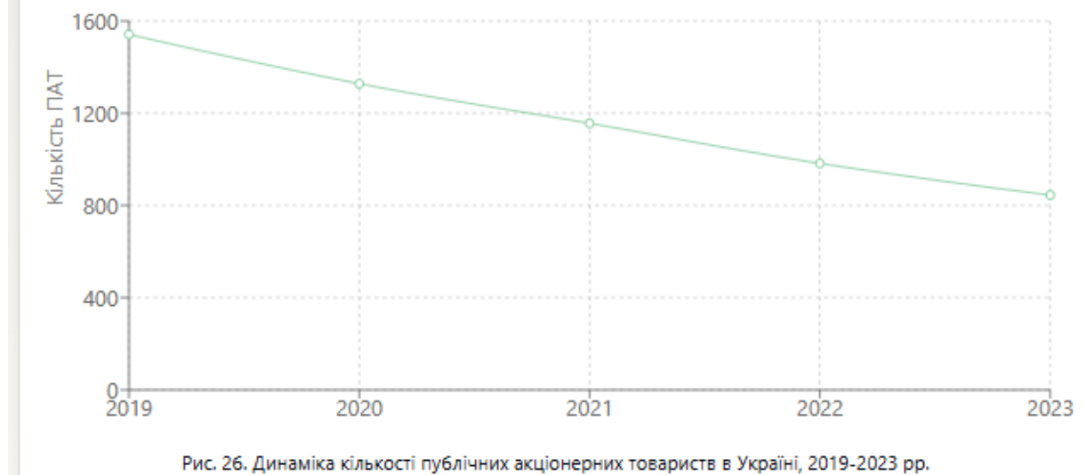
Рис. 2б. Динаміка кількості публічних акціонерних товариств в Україні, 2019-2023 рр.