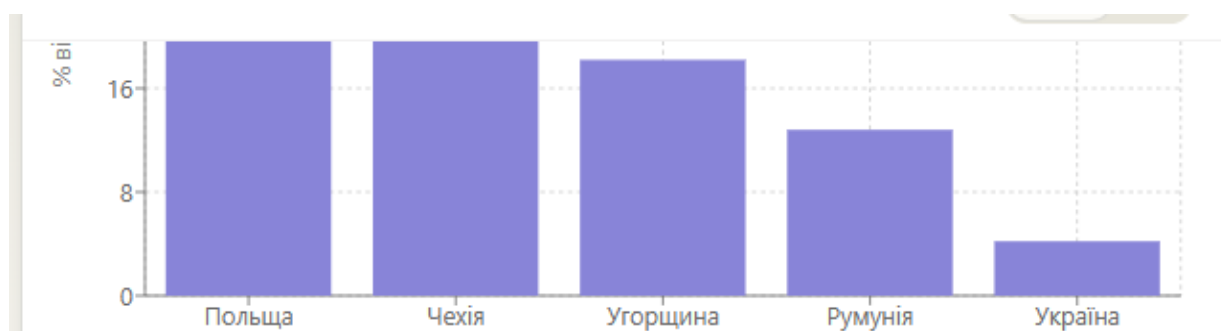
Рис. 2а. Співвідношення капіталізації фондового ринку до ВВП у країнах регіону, 2023 р.

Україні (4,2%) значно поступається показникам інших країн регіону, таких як Польща (28,4%), Чехія (21,6%), Угорщина (18,2%) та Румунія (12,8%). Це свідчить про недостатній розвиток ринку акцій та його обмежену роль у фінансуванні економіки. Рис. 2б демонструє стійку тенденцію до скорочення кількості публічних акціонерних товариств в Україні. За період 2019-2023 рр. їх кількість зменшилась з 1542 до 845 компаній, що відображає процес делістингу та зниження привабливості публічного статусу для українських компаній. Така динаміка негативно впливає на ліквідність ринку та можливості для диверсифікації інвестиційних портфелів.