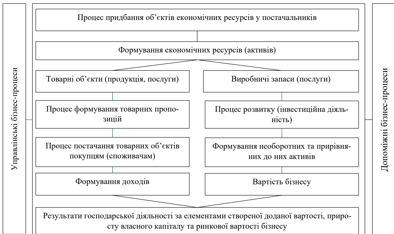
Рис. 2. Механізм руху об'єктів в бізнес-процесах при здійсненні господарської діяльності торговельної організації

В результаті виконання базових бізнес-процесів забезпечується мета господарської (підприємницької)